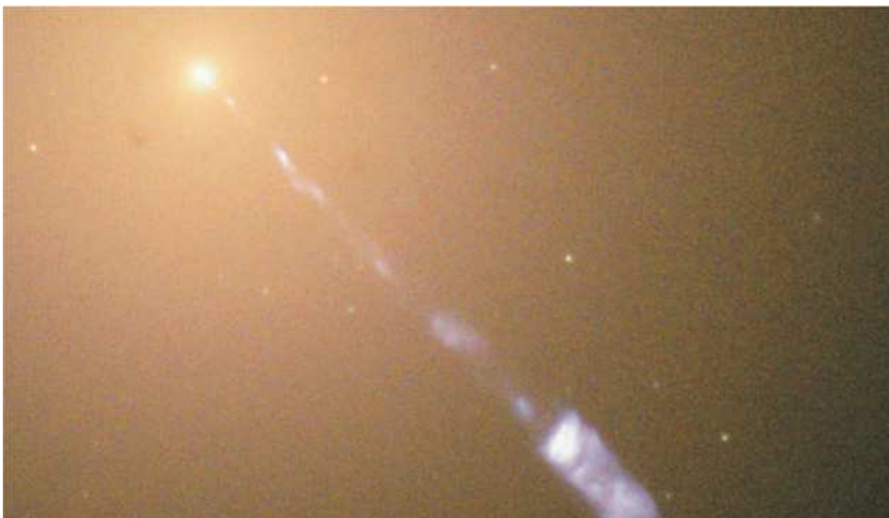
(A) La galassia M87 e il suo getto di plasma visto con il Telescopio spaziale Hubble.

Una delle immagini più spettacolari della galassia massiccia Messier 87 (o M87) (12h 30m 49.45 +12deg 23' 28") è stata catturata dal telescopio spaziale Hubble (HST) nella banda ottica dello spettro elettromagnetico (480 - 780 nano-metri) nel 1998. M87 si trova a soli 55 milioni di anni luce da noi e fa parte del vicino ammasso di galassie della Vergine. M87 appare nelle foto (A) come una "stella" brillante ed evidente è il suo getto di plasma ben collimato e luminoso. La presenza del getto di materia rafforza la convinzione sulla presenza di un buco nero massiccio al centro della galassia M87.